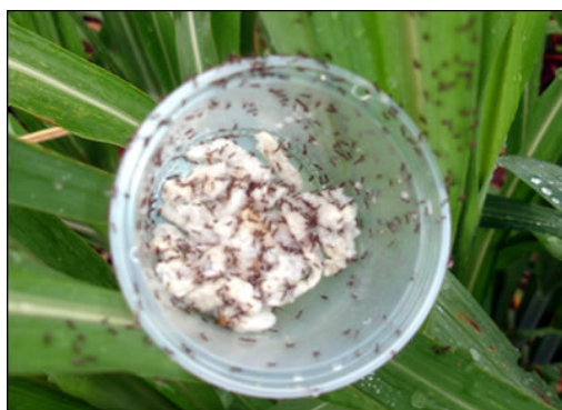
Vespinhas Cotesia flavipes (extermina a praga)