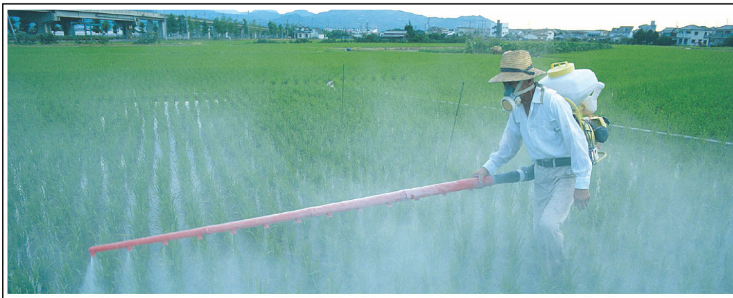
Uso indiscriminado de pesticidas agrícolas.