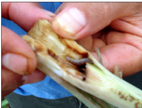
Lagarta-da-broca (praga da cana-de-açúcar)